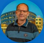
5. Kees Bin Zierikzee Industriële Automatisering